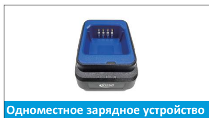
Одноместное зарядное устройство