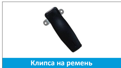
Клипса на ремень